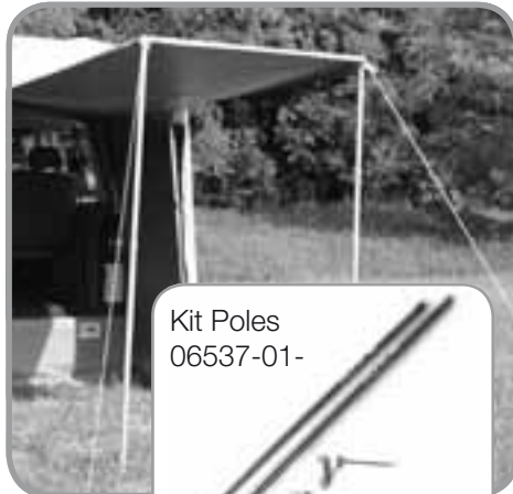
Kit Poles 06537-01-