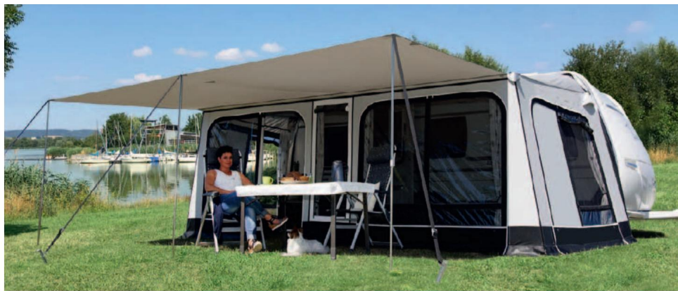
10 Ještě nikdy jste nemohli začít dovolenou tak rychle.