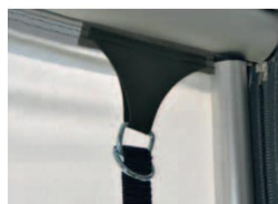
Další kotevní zařízení