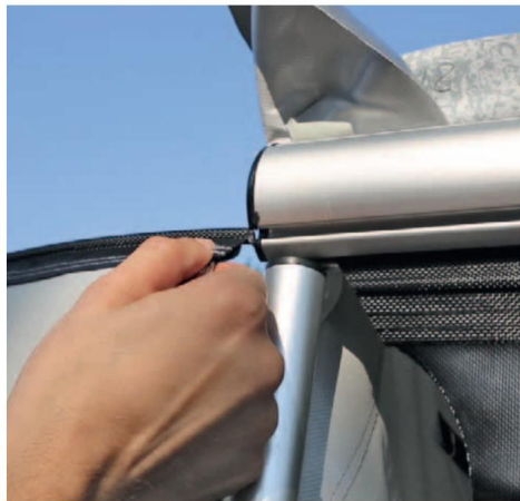
6 Zatažením přední stěny