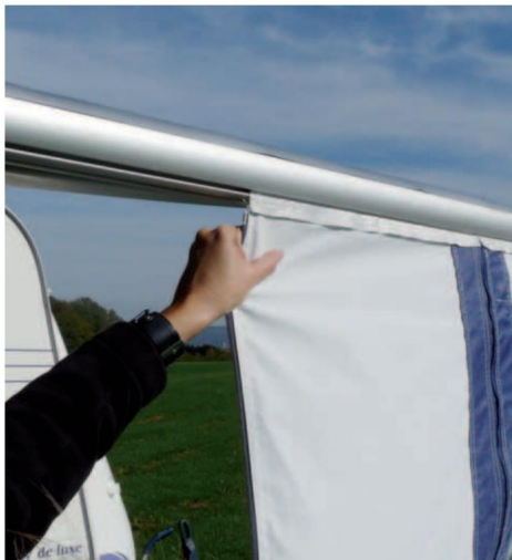
7 Zatažením přední stěny