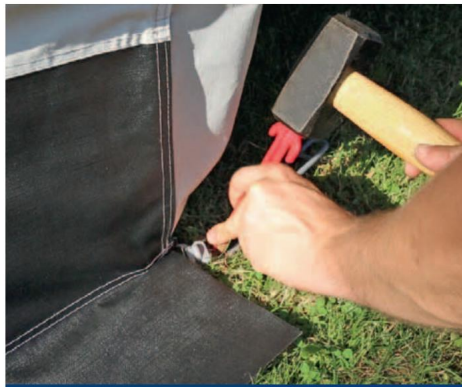
9 Odepněte invalidní vozík