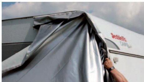
Natáhněte 1 rolovací pytel

Zavřete střechu co nejdále (např může to být ta přepravní taška vpředu a vyčnívá vzadu)